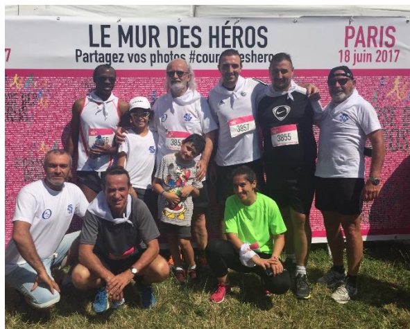
Une partie de l'équipe Les Amis de Mattéo