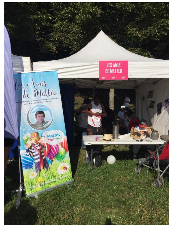
Le stand Les Amis de Mattéo