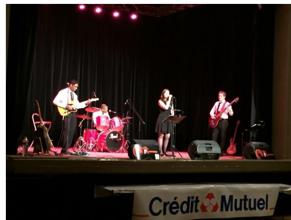
Groupe MIMIC Pop-Rock en acoustique